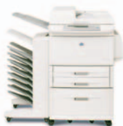
HP LaserJet 9040/9050mfp com caixa de correio com 8 tabuleiros

Cabo de alimentação, cartucho de impressão, documentação da impressora, software da impressora em CD-ROM, película para o painel de controlo, dois tabuleiros de entrada para 500 folhas de série, tabuleiro com várias finalidades para 100 folhas, tabuleiro de entrada para 2 000 folhas, acessório módulo para impressão duplex automática (pré-instalado), Servidor de Impressão Incorporado HP Jetdirect, alimentador automático de documentos (ADF). O dispositivo de saída de papel necessário deve ser seleccionado e encomendado separadamente.