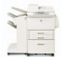
HP LaserJet 9050mfp com empilhador opcional

Departamentos comerciais e de empresas, bem como departamentos múltiplos em médias empresas, com grupos de trabalho de 30-50 utilizadores que necessitam de acesso simples à rede para obterem, de forma rápida, fiável e económica, impressão e cópias a preto e branco até A3, digitalização a cores, para além de uma gama de opções de fax, acabamento e transmissão digital, em prol de uma maior eficiência, produtividade e um fluxo de trabalho automatizado.