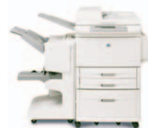
HP LaserJet 9040/9050mfp com sistema de acabamento multi-funções

Proporciona capacidade de empilhamento de até 3 000 folhas, assim como agrafamento em várias posições para até 50 folhas de papel por trabalho.