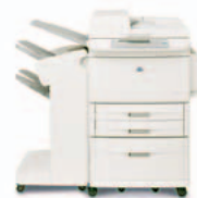
HP LaserJet 9040/9050mfp com agrafador/empilhador

Empilha até 3 000 folhas de papel com separação de trabalhos em espinha.