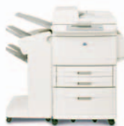
HP LaserJet 9040/9050mfp com empilhador

Cada caixa de correio pode ser atribuída a um indivíduo, grupo de trabalho ou departamento, para uma fácil obtenção de trabalhos. A caixa de correio também pode ser configurada como classificador/intercalador, empilhador e separador de trabalhos.